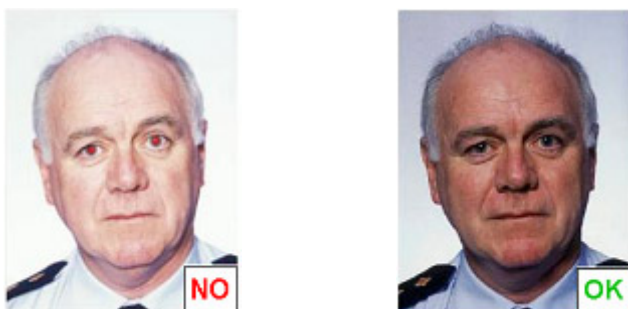
Effetto occhi rossi